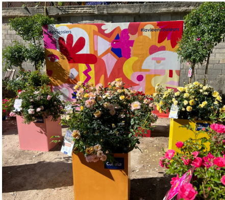
Léona Rose - 2023